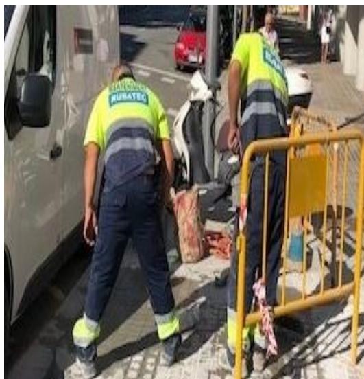
Reparació via Pública